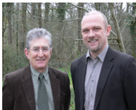
Jean Saint-Josse et Frédéric Nihous