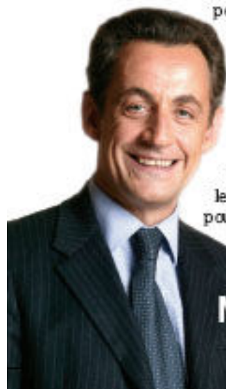
NICOLAS SARKOZY

Je souhaite que nous atteignions le plein-emploi en moins de cinq ans. C'est possible. Chacun pourra avoir un travail stable à temps complet, je pense notamment aux femmes. C'est ainsi que nous lutterons le mieux contre la pauvreté et l'exclusion.